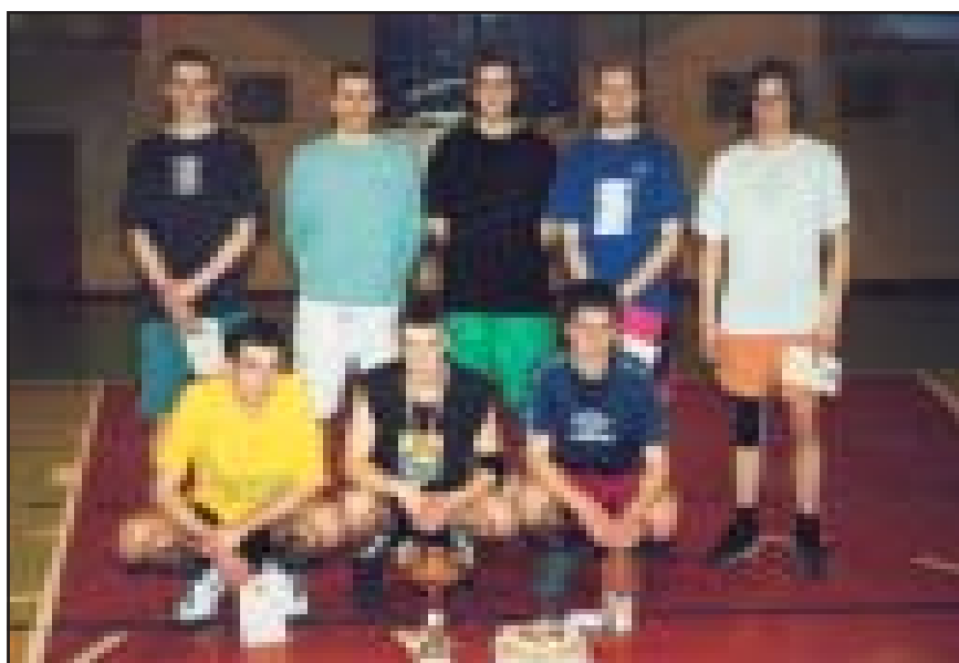
Fakultetų krepšinio turnyro nugalėtoja - IF „Igel“.

Totalizatorių laimėjo V. Čerauskas (IF I k.).