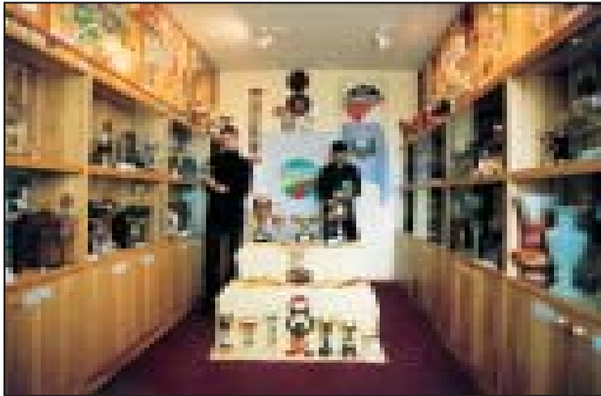
VPU sporto muziejuje.