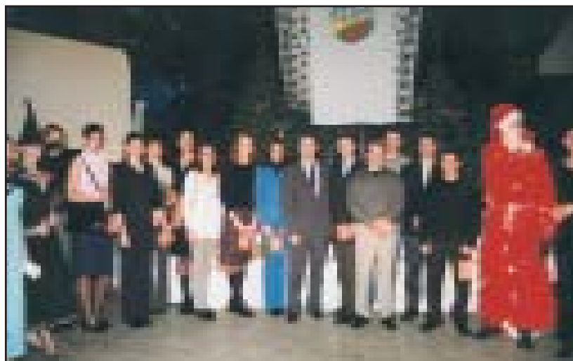
Apdovanojami VPU studentai - Lietuvos čempionai.

„Šviesos - Eglės“ rankininkės tapo Lietuvos čempionėmis ir iškovojo TV taurę.