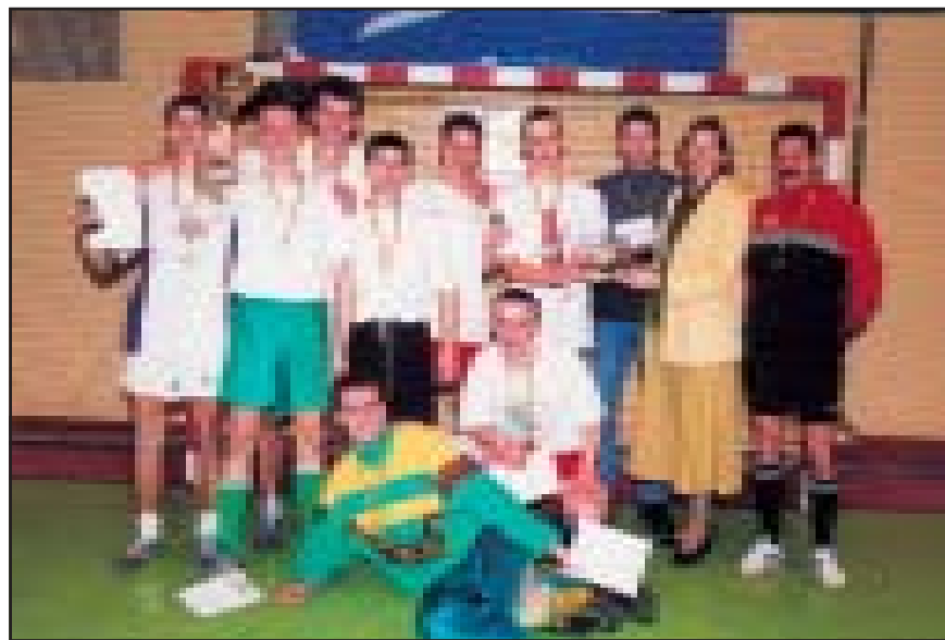
„Juventus“ taurės laimėtoja – „Loko“ komanda.

Turnyre dalyvavo 8 komandos: „Be vilčių“ (MF), „Sterlingas“ (GMF+MF+KK), „Loko“ (KK+SF), „Gmifas“ (IF+KK+FTF), „Istoric United“ (IF+FTF+LF+KK), „Geksa“ (SF), „Šunias“ (MF+IF+KK) ir „Specialistai“ (KK).