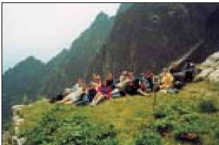
GMF studentai Tatrų kalnuose.

Pavieniai studentai išvyko į keliones po Alpes, Tatrų kalnus.