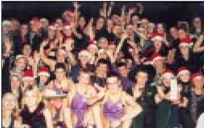
Po Kalėdų taurės apdovanojimų krepšinininkai su aerobikos grupių sportininkėmis.