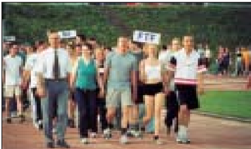
Sporto šventėje dalyvavo visų fakultetų studentai.