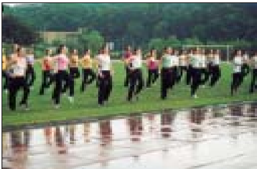
Net lietus neišvaikė aerobikos mėgėjų.