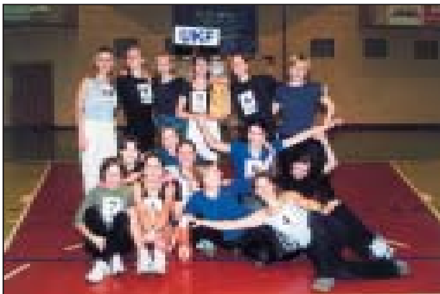
UKF studentės – estafečių varžybų nugalėtojos.