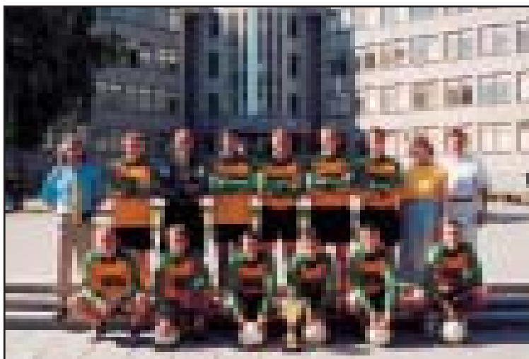
VPU „Šviesa“ – Lietuvos studentų futbolo lygos čempionė.