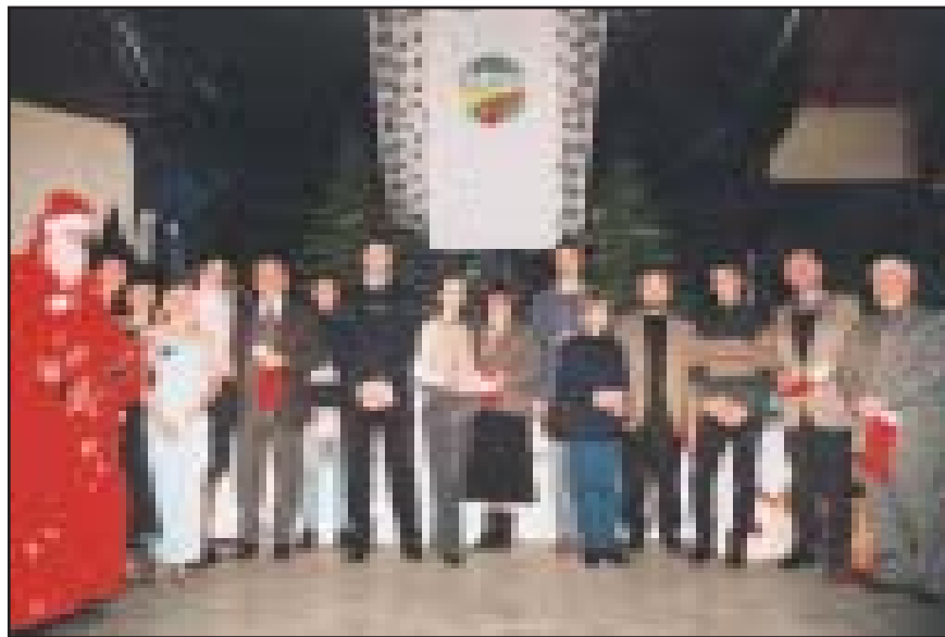
Apdovanoti geriausi fakultetų sportininkai su dekanais ir prodekanais.