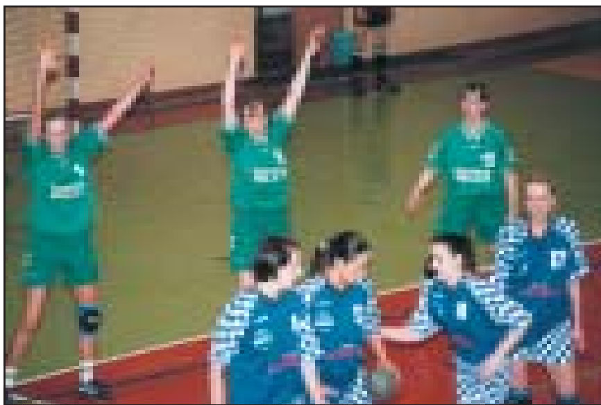
„Šviesos – Eglės“ rankininkės ginasi.

Turnyrą laimėjo „VIKO“ 23:19 įveikusi „Šviesą“ ir 22:22 sužaidusi su Lietuvos jaunimo rinktinė. Antros liko Lietuvos jaunimo rinktinės rankininkės, 18:15 įveikusios „Šviesą“. III vietoje – „Šviesa“.