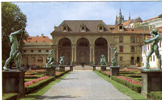
Wallensteino rūmai ir sodas Mažajame mieste