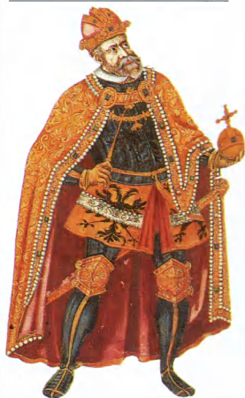
Rudolfas II (1576–1612)