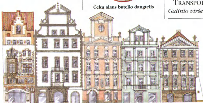
Senamiesčio aikštės rytinio galo namų barokiniai fasadai

TRANSPORTO PLANAS Galinio viršelio vidinė pusė