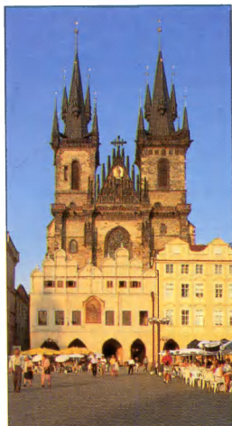
Týno Mergelės Marijos bažnyčia