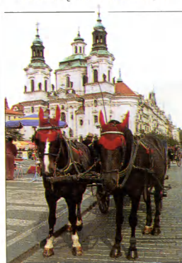
Fiakras, Senamiesčio aikštė