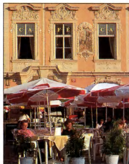
Lauko kavinės stalieliai